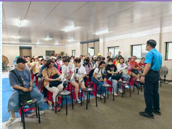
交通部常務次展林國顯代表貴賓致詞