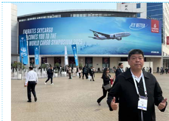
2025 IATA World Cargo Symposium

此外，在阿聯酋航空台灣分公司的協助下，主辦單位特別安排台灣代表團參訪杜拜的兩座主要機場——現行營運的杜拜國際機場（DXB）以及正在建設中的阿勒馬克圖姆國際機場（DWC），實地了解杜拜空運物流基礎建設的發展現況與未來布局。