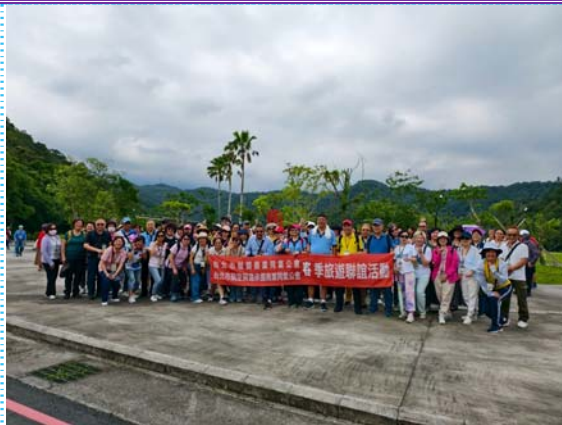
114/05/17 龍潭湖畔環湖步道