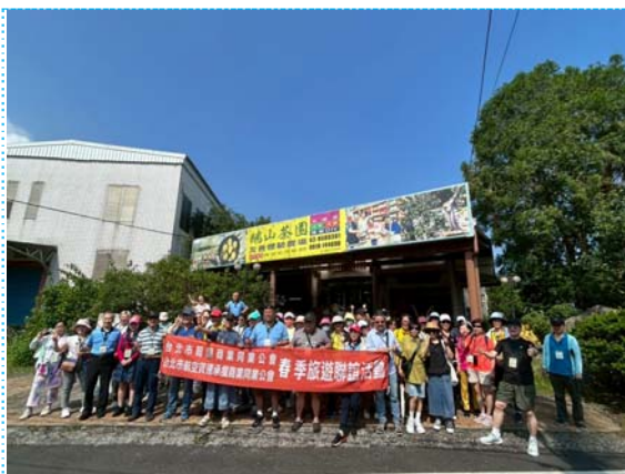
114/05/17 兩公會春季旅遊-茶體驗

114/05/17(六)舉辦「宜蘭礁溪茶體驗，龍潭湖」一日遊。(160 人參加)