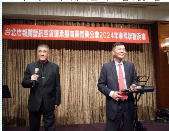
113/02/22 兩公會於大倉久和飯店舉辦 2024 年度春酒圓滿成功（左起：陳理事長、黃理事長）