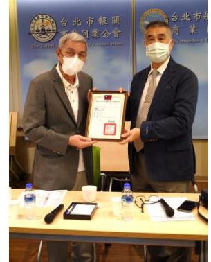
報關商業同業公會全國聯合會第 5 屆第 1 次會員大會