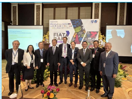
2024/07/10~13 FIATA RAP Meeting in Bali IDN