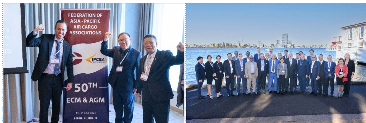
113/06/12~16 FAPAA 50 th ECM & AGM in Perth AU