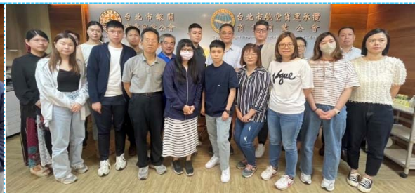
危險物品規則：7.3 複訓、初訓