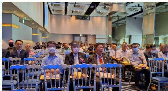
113/04/14 由陳理事長及吳代理事長出席基隆市報關公會第 32 屆會員大會。

為感謝各理監事參與內部會議，及各相關單位召開之各項外部會議，協助解決會（業）務，依端午佳節慣例發放每位理監事 1,500 元禮券。