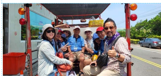
搭乘鐵牛車進入潮間帶