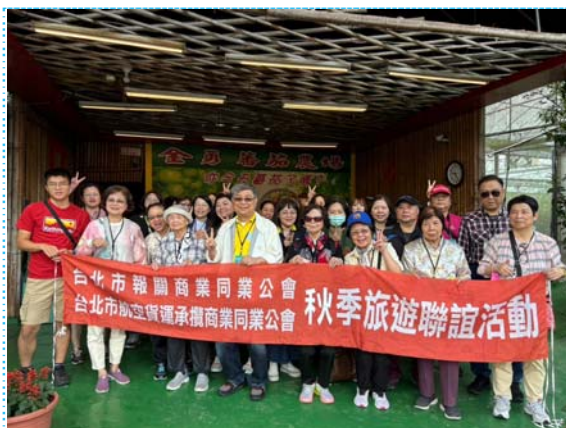
金勇番茄觀光農場