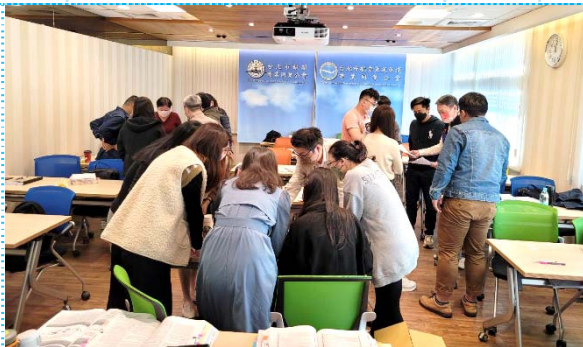
DGR CBTA 7.3 初訓學員分組討論實作