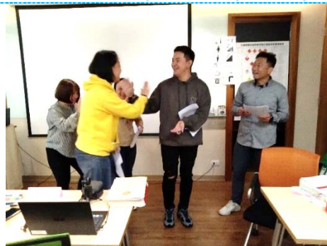
DGR CBTA 7.3 複訓學員上台報告完成作業