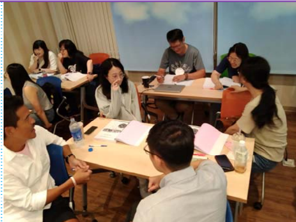
2024/08/03~24 IATA 航空貨運基礎課程