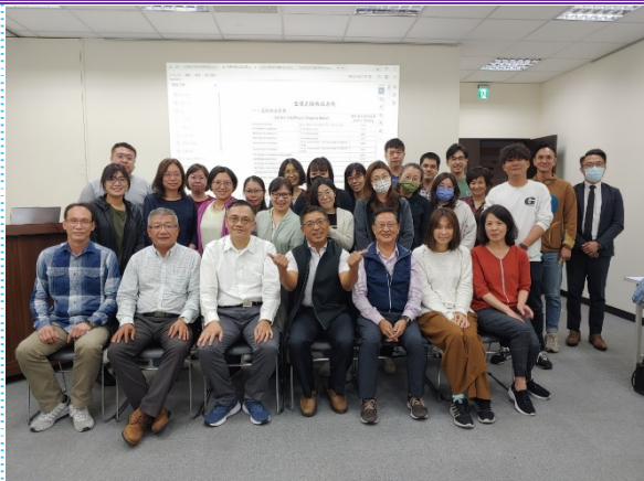
DGR CBTA 7.3 高雄複訓班合影