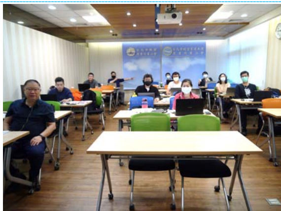
公會培訓 9 位+榮儲 5 位+臺勤 1 位，共計 15 位

2 · 111 年 10 月 31 日~11 月 4 日完成舉辦 CBTA DGR 講師課程，15 名學員已全數通過。