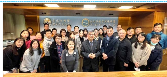
危險物品初訓課程