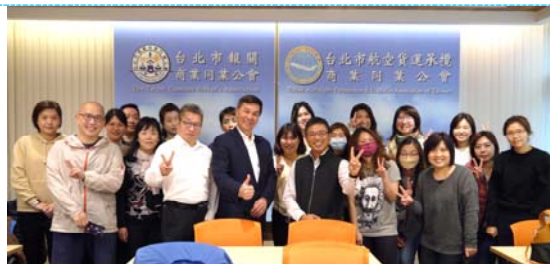
危險物品複訓課程