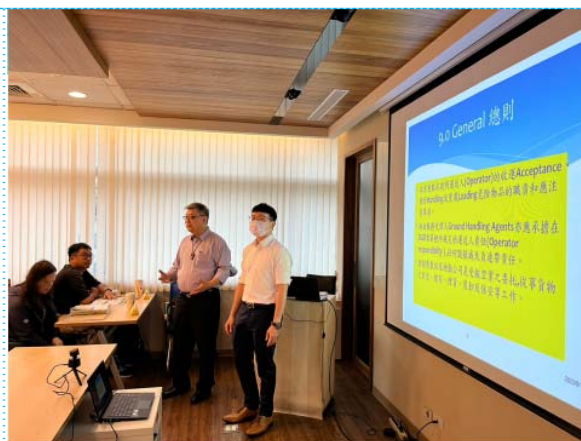
DGR CBTA 7.3 補訓課程