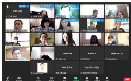
危險品課程視訊上課合影