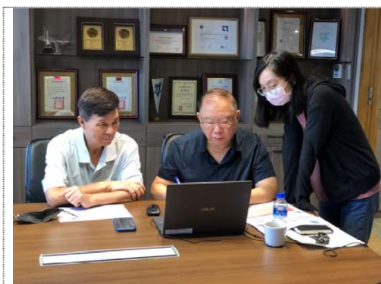
FAPAA 48th Executive Council Meeting (視訊)