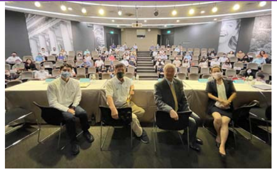
「運送契約賠償責任及物流產業資安分享」專題研討會後和全體與會者合影