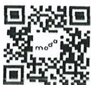
地方政府身心障礙者 職業重建服務窗口