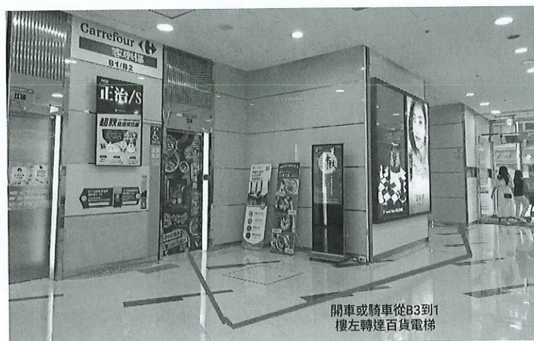
開車或騎車從B3到1樓左轉達百貨電梯